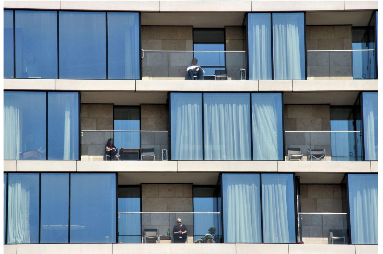
Yves Jalabert 8°