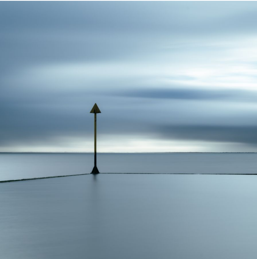
Gilles Garraud "Balise"