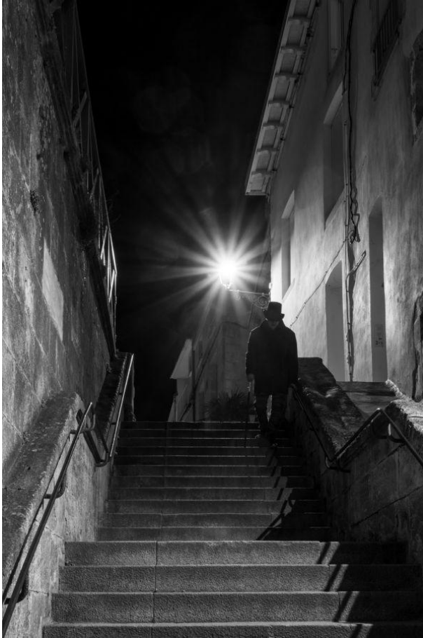
Dominique Girod 5°